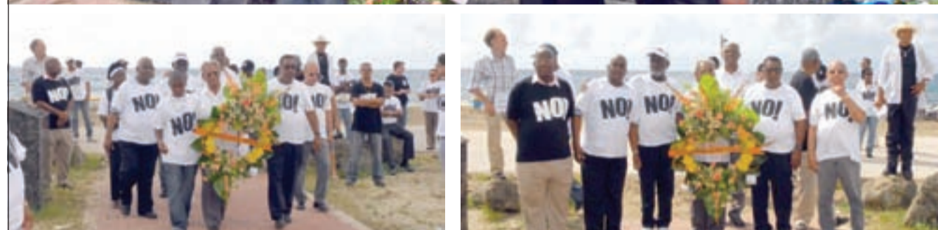
Ponemento di krans y bistimento di estatua di Tula y Karpata cu flanel: NO!!